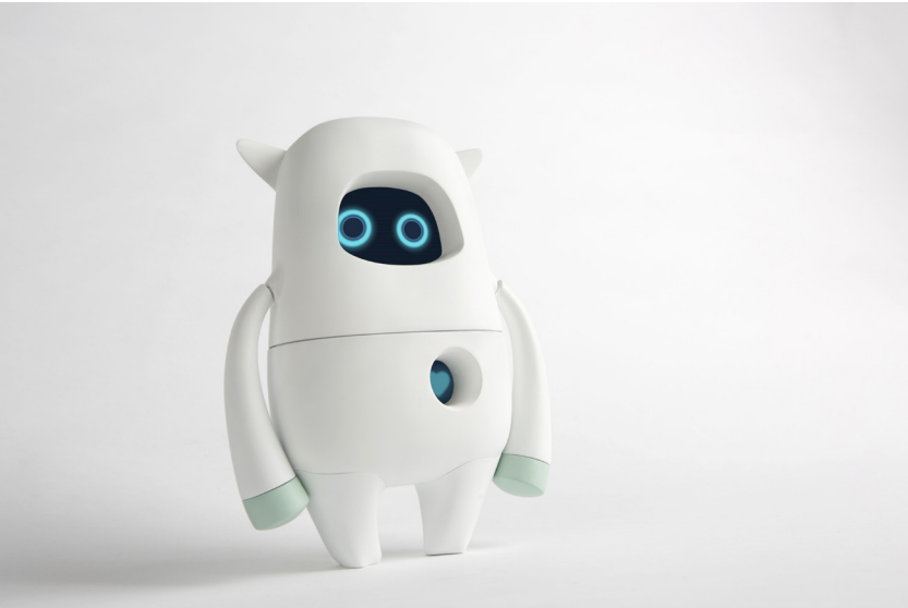
AKA, "Musio K", 2016, © AKA, LLC.

San Telmoko erakusketa iraunkorraren Industrializazio-aretoan kokatu da erakusketa, museoko lehen solairuan, eta uztailaren 12tik irailaren 29ra bitarte egongo da ikusgai.